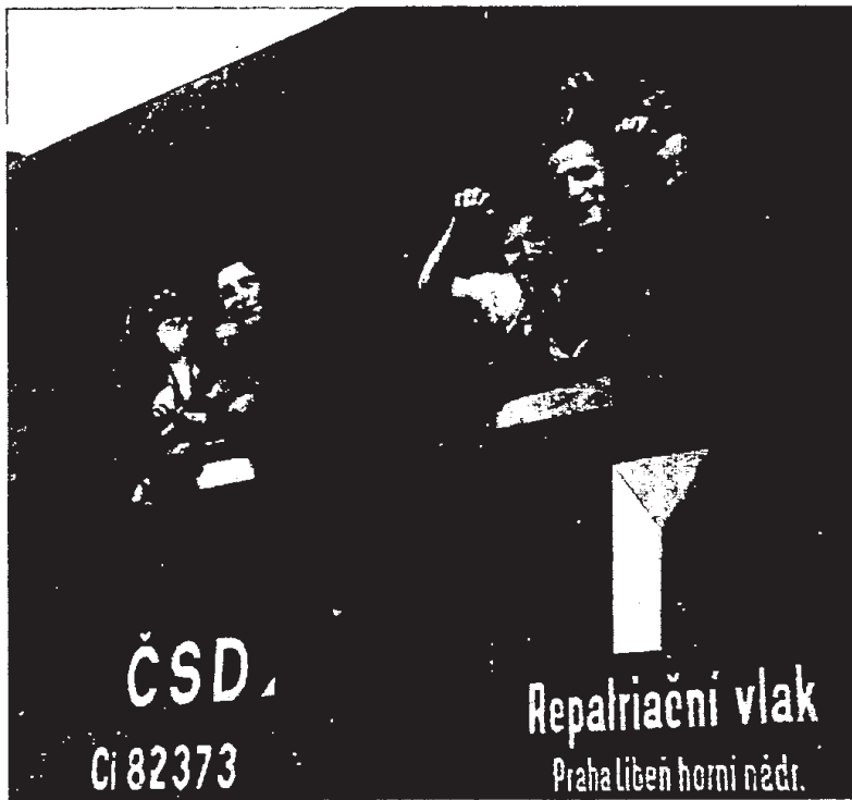
רכבת מיוחדת עבור ילדים