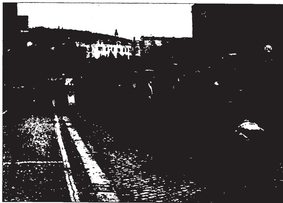
בעיר הגבול נאכוד

מריאנקה טלפנה אלי ומסרה שלידי הבוס הגיעה ידיעה שקבוצת צעירים יהודים נתפסה בגבול נאכוד והיא נמסרה לידי הצבא העומד להחזירה לפולין. מיהרתי לגבול